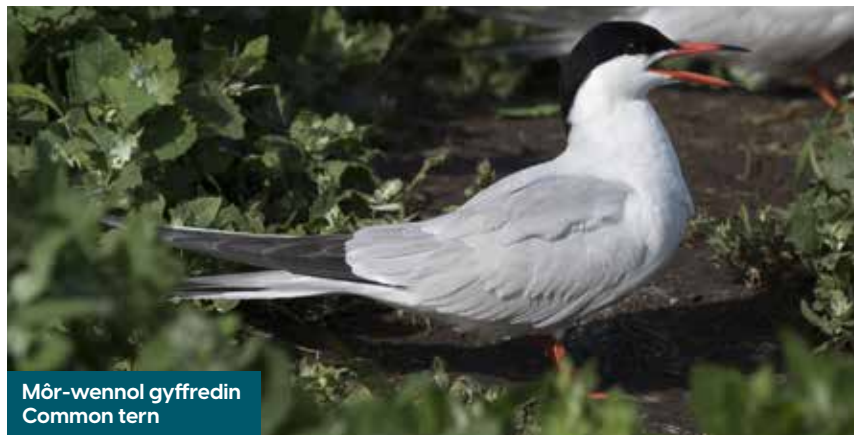
Môr-wennol gyffredin Common tern