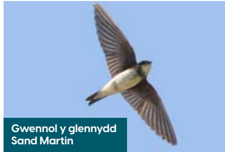
Gwennol y glennydd Sand Martin