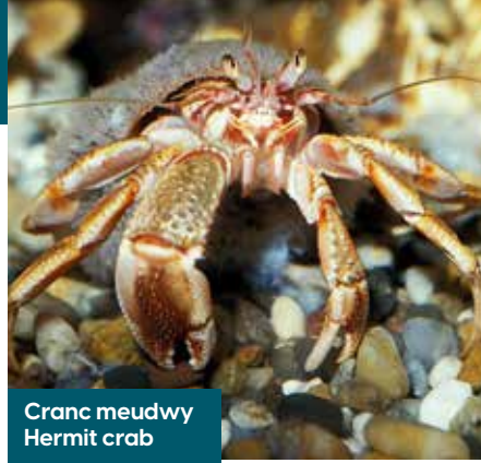
Cranc meudwy Hermit crab

Adar mudol yr haf yw'r rhain ac maen nhw i'w gweld rhwng mis Ebrill a mis Medi. Maen nhw'n bridio ar draethau graeanog, ar nysoedd creigiog neu yng nghefn gwlad mewn cronfeydd dŵr neu hyd lannau afonydd. Mae ganddynt adenydd hir, cul, pig syth a chynffon fforchog a'r nodweddiad hyn a'r ffordd maen nhw'n symud sydd i gyfrif am eu henw. Mae eu cyrff yn wyn oddi tanynt ac mae ganddynt gefn llwyd, gyda chap du llawn neu rannol ac mae blaen eu pig oren cochlyd yn ddu. Maen nhw i'w gweld yn hofran uwchben y môr ac yn defnyddio eu chwimder anhygoel i blymio i'r môr i ddal pysgod yn awr ac yn y man.